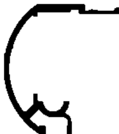
BX-084 0,745 Kg/m