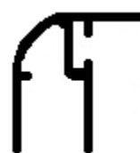
BX-093 0,152 Kg/m