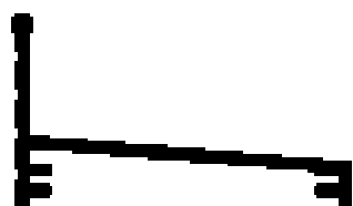
BX-169 0,248 Kg/m